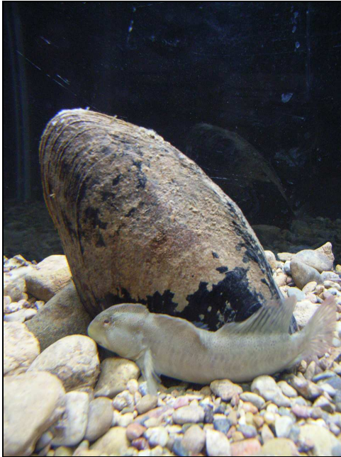
Fig. 2 Ejemplar de blenio de río junto a Margaritifera auricularia

siendo una meta lograr cerrar el ciclo reproductivo de la almeja en cautividad o en semilibertad, pero de nada valdrá tener ejemplares criados si luego no se pueden reintroducir en el medio natural para mejorar las poblaciones actuales.